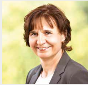
Das Demographie Netzwerk e. V.

Institut für Bildung, Arbeit und Gesellschaft Universität Hohenheim Wollgrasweg 49, 70599 Stuttgart